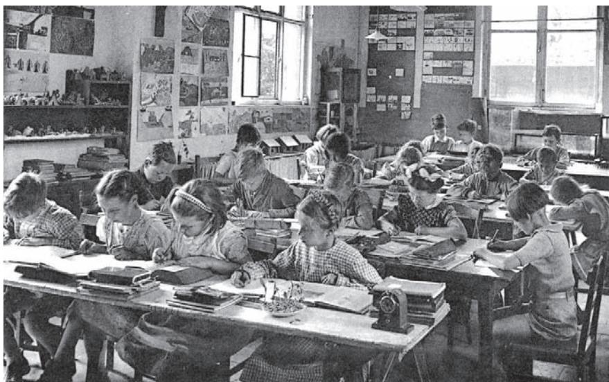
Imatge 4. Treballant amb els quaderns d'observació (targeta postal)