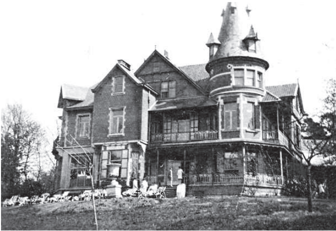
Imatge 1. Vil·la Montana, poc després de la mudança (1927)