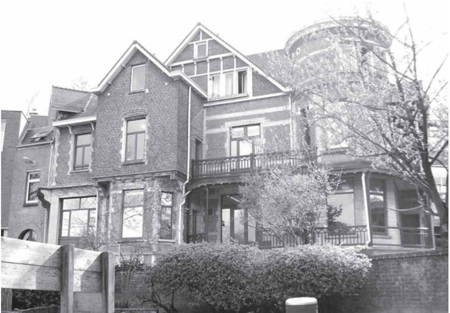
Imatge 2. La vil·la, centre administratiu de l'escola (any 2008)