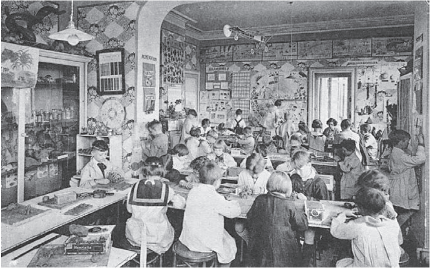
Imatge 5. Modelatge amb argila (targeta postal)